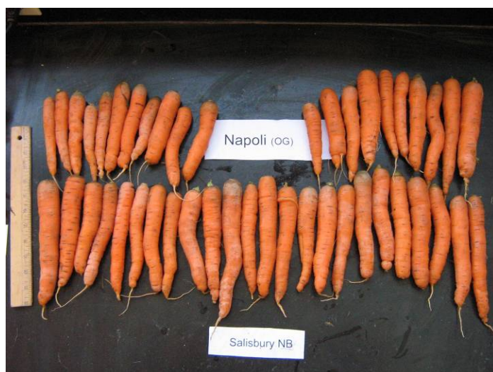
Les carottes récoltées ont été catégorisées, pesées et mesurées et leur couleur et uniformité ont été évaluées

La densité des carottes était considérablement différente d'un cultivar à l'autre au moment de l'émergence et de la récolte (Tableau 2). Les peuplements des récoltes des semences produites de manière conventionnelle n'étaient pas supérieurs à ceux des semences biologiques. Les faibles germination et émergence pourraient être imputables au dépôt par le semoir poussé d'une quantité moindre de semences que celle qui avait été prévue, à un mauvais contact semence-sol, à des conditions environnementales (température, humidité, encroûtement du sol, etc.) ou à une combinaison de ces facteurs. Porter une attention particulière à des conditions de couches de semences suffisantes au moment de la plantation peut aider à produire un meilleur peuplement à la récolte. Les cultivateurs qui ont un plus grand volume de carottes pourraient être mieux servis en investissant dans un épandeur de précision qui peut être calibré pour s'ajuster à des dimensions de semences variables.