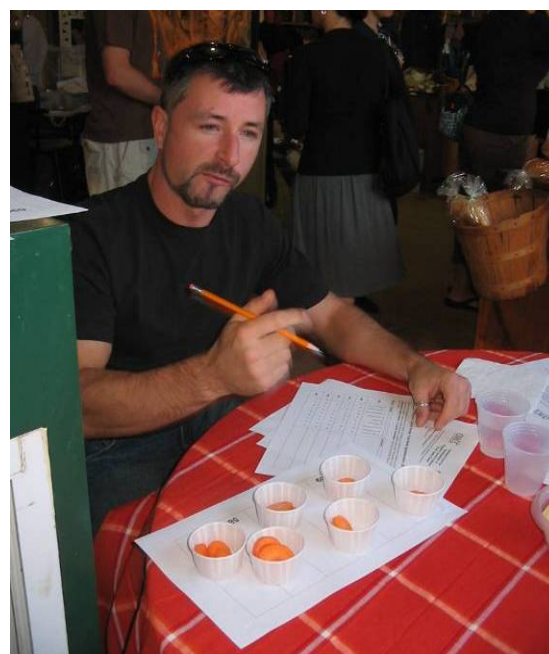
Un participant au test de préférence des cultivars de 2007 à Charlottetown à l'Î.-P.-E. (S. MacKinnon)