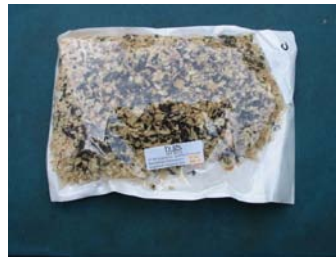
Emballage de pupes parasitées mélangées à des copeaux de bois.

Fournisseurs canadiens qui expédient partout au pays :