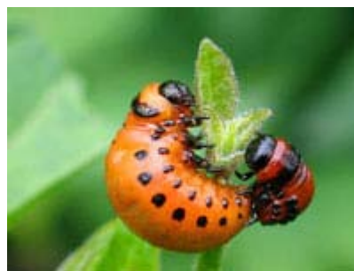
Doryphore de la pomme de terre immature.