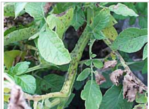
Symptômes de brûlure hâtive grave.

La brûlure hâtive est essentiellement une maladie des plantes les plus âgées ou des plantes qui subissent un stress comme une infection par un autre organisme pathogène des plantes ou un manque d'azote ou d'eau. Une irrigation excessive peut également rendre les plantes vulnérables. Les feuilles du bas sont généralement infectées en premier. La brûlure hâtive peut apparaître tôt dans la saison mais le taux d'infection augmente rapidement après la floraison. Les tomates et les autres solanacées sont des hôtes de la brûlure hâtive. La maladie a aussi été signalée chez d'autres plantes comme certaines crucifères. Il y a plusieurs races de cet organisme pathogène. Certaines sont hautement pathogènes tandis que d'autres sont saprophytes et vivent dans le sol sur de la matière organique morte. L'organisme pathogène peut survivre sur des débris de culture, comme saprophyte dans le sol, sur des tubercules infectés et sur d'autres hôtes.