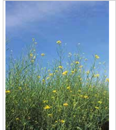
Les moutardes peuvent être utilisées en rotation dans le cadre d'une stratégie de lutte contre les maladies et les nématodes.

Les rotations qui comprennent des cultures-abris ont l'avantage d'ajouter de la matière organique et de l'azote au sol. Ceci en général réduit le coût des intrants dans le temps. La matière organique aide le sol à résister au tassement, permet une meilleure pénétration des racines, permet au sol d'emmagasiner plus d'humidité et aide l'eau à pénétrer le sol. Les cultures-abris et les engrais verts comprennent entre autres les légumineuses, l'herbe du Soudan et la moutarde. On a montré également que les moutardes jouent un rôle positif dans la lutte contre les ravageurs du sol (McGuire, 2003).