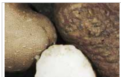
Les nématodes cécidogènes sont communs dans les systèmes de culture des pommes de terre biologiques de l'ouest et sont la cause principale de la fumigation du sol dans la production commerciale des pommes de terre dans le nord-ouest.

Des développements prometteurs ont eu lieu récemment dans le domaine de la biofumigation avec des cultures-abris de moutarde plantées en rotation avant les pommes de terre. Les cultures de crucifères comme la navette et la moutarde contiennent des substances chimiques actives appelées glucosinolates. On a montré que la décomposition de ces substances chimiques inhibait certaines maladies transmises par le sol, les nématodes et les semences des mauvaises herbes. La meilleure stratégie pour la suppression des maladies transmises par le sol et des nématodes consiste à sélectionner une espèce de moutarde qui produit de grandes quantités de biomasse et de glucosinolates. Aussi, avant l'incorporation, hachez l'engrais vert avec une tondeuse rotative ou un hacheur à fléaux à grande