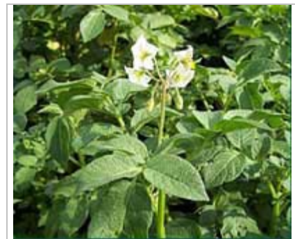
Plant de pomme de terre

La présente publication présente des approches à la production durable et biologique des pommes de terre. Les pratiques comprennent la gestion de la fertilité et des éléments nutritifs, la lutte biologique et biorationnelle contre les insectes, les maladies et les mauvaises herbes, l'entreposage et la commercialisation.