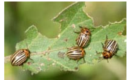
Doryphores de la pomme de terre adultes.