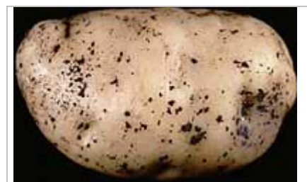
Rhizoctonia (rhizoctone brun) sur les tubercules de pomme de terre.

Le champignon survit dans le sol soit sous forme de mycélium associé aux résidus de plantes en décomposition soit sous forme de sclérote, la terre qui demeure sur les tubercules non récoltés après lavage. Les infections transmises par le sol, appelées la phase chronique de la maladie, ne touchent généralement pas les germes. Au lieu de quoi, les infections transmises par le sol entraînent une réduction de la qualité des tubercules et du rendement en effeuillant les tubercules et en entraînant l'apparition de lésions rouge-brun qui peuvent devenir des chancres.