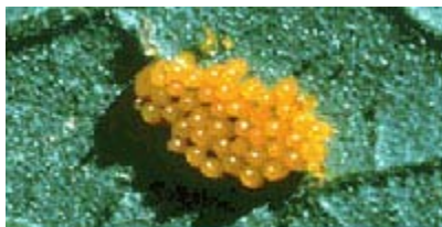
Les œufs de doryphore de la pomme de terre sont d'un orange brillant et habituellement situés sous les feuilles.

Une combinaison de plusieurs stratégies peut contribuer à limiter les populations de DPT. La rotation des cultures, effectuée de préférence avec du maïs cultivé, du blé ou une autre culture qui peut tolérer un pH de 6,0, peut retarder la croissance de la population de DPT. Idéalement, les champs en rotation devraient être isolés de la plantation de pommes de terre de l'année précédente.