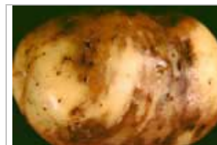
La brûlure tardive sur un tubercule de pomme de terre.