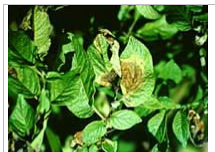
Brûlure tardive sur une feuille de pomme de terre.

Parmi les variétés de pommes de terre disponibles dans le commerce aux États-Unis qui présentent une résistance à la brûlure tardive, mentionnons la New York 121, une variété de mi-saison/fin de saison, deux variétés de Hungarian